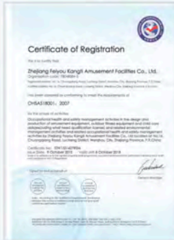
This is to certify that